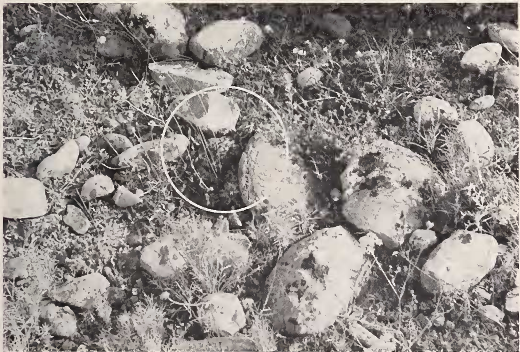
Abb. 6: Sich drückendes Küken.